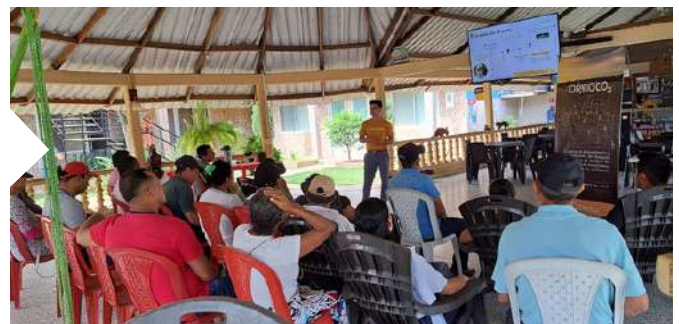
Cumaribo, Vichada - Colombia