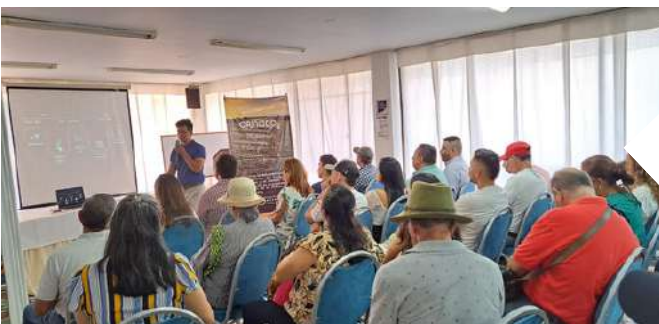
Villavicencio, Meta - Colombia

¡Continuamos trabajando para ampliar las áreas de conservación en los departamentos del Meta y Vichada.