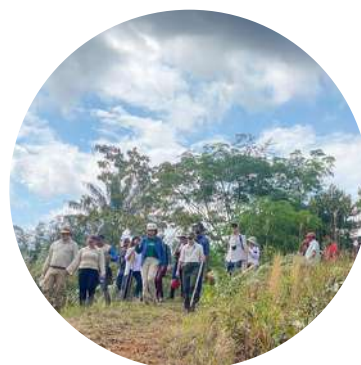
Florencia, Caquetá - Colombia