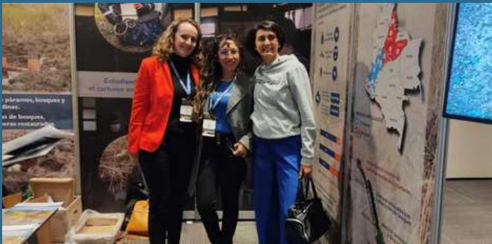
Bogotá - Colombia