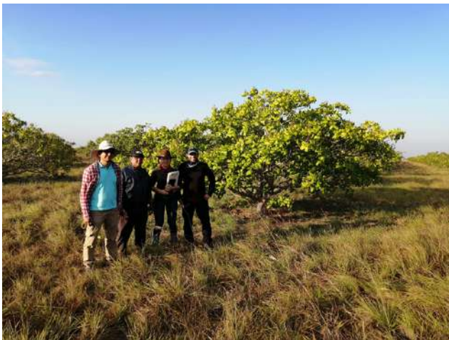
Puerto Carreño, Vichada - Colombia