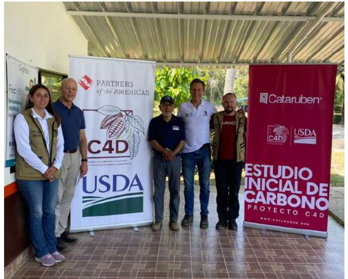
Santander - Colombia

El programa "Cacao for Development" (C4D) se creó hace unos años con una donación de 83 mil toneladas de trigo por parte de agricultores estadounidenses para apoyar a los agricultores de cacao en Colombia. Uno de los objetivos principales de C4D es monetizar el servicio de captura de carbono en los ecosistemas de cacao.