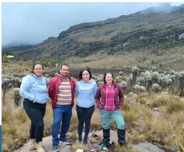
Duitama Boyacá - Colombia