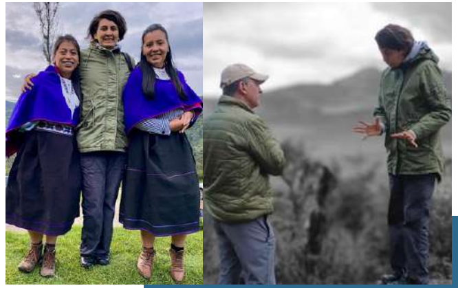
Cauca - Colombia

En esta visita, tuvimos la oportunidad de hablar con los habitantes de esta comunidad y presentarles las diversas acciones que estamos llevando a cabo para hacer frente a este problema global. Por esto hemos extendido una invitación, para que sean ellos mismos quienes lideren el desarrollo del proyecto y puedan obtener beneficios para su comunidad. Creemos firmemente en el poder del trabajo en equipo y la participación activa de las comunidades locales, para lograr un impacto real en la lucha contra el cambio climático.