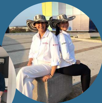
Barranquilla Atlántico - Colombia