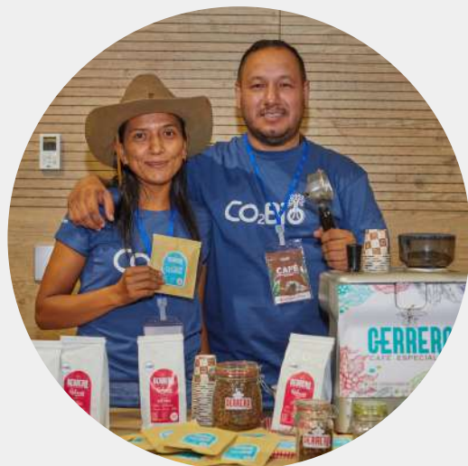
Producto: Café Cerrero (4 orígenes) Predio: San Benito