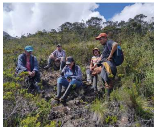
Arcabuco, Boyacá - Colombia

Tuvimos un cierre exitoso en nuestro primer convenio de transferencia de conocimiento con el programa Páramos y Bosques de USAID. Durante los últimos 3 meses, se llevaron a cabo actividades de capacitación dirigidas a 6 gestores y 4 organizaciones locales (Fundación Procuenas Río Piedras, AsoAmaime, AsoPalm y Fundación Ecológica Las Mellizas) ubicadas en los departamentos de Cauca, Valle del Cauca, Quindío y Tolima. Este convenio permitió la transferencia de capacidades y conocimientos valiosos con relación a la gestión y conservación de los recursos naturales en la región.