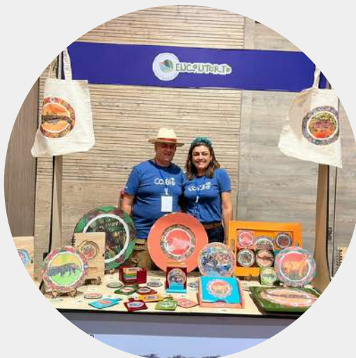
Producto: Artesanías Predio: RNSC Encanto de Guanapalo