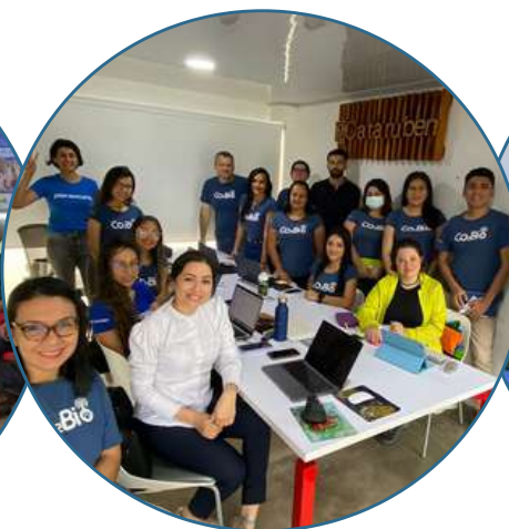
Equipo Cataruben Yopal, Casanare - Colombia