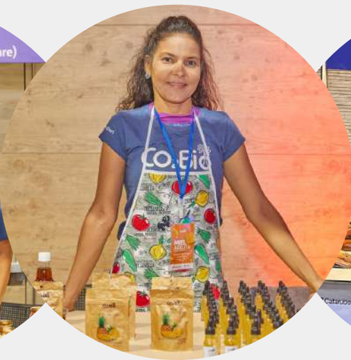
Producto: Fruta deshidratada Predio: Villa Aurora