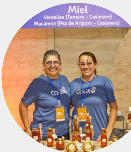
Producto: Miel Versalles Predio: Versalles