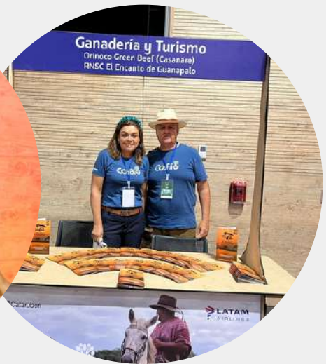
Producto: Turismo y ganadería sostenible Predio: RNSC Encanto de guanapalo