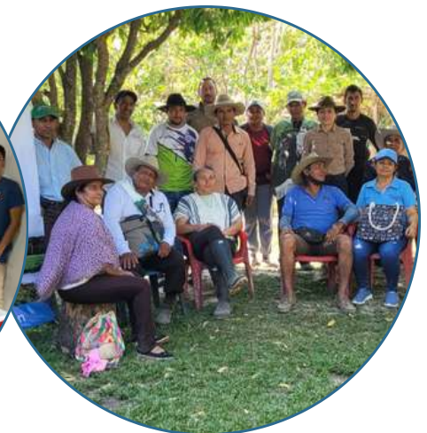
Predio: Lejanías Paz de Ariporo Casanare - Colombia