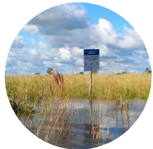
Señalización del predio