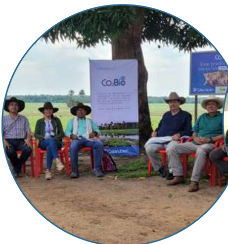
Predio: RNSC Buenaventura Trinidad Casanare - Colombia

La iniciativa CO2Bio dió inicio en la etapa de verificación con OVV Versa , con el fin de certificar nuevamente a los propietarios inscritos en el proyecto. La auditoría se llevó a cabo en la semana del 13 de marzo en las oficinas de la Fundación Cataruben y los predios RNSC Buenaventura y Lejanías.